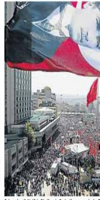
Sabvarsen mit Atatürk: Die jüngste Protestbewegung in der TTU

Nach geistreich durchdachter, vergleichender Zergliederung des türkischen und der hauptsächlichsten sonst bekannten Regierungssysteme resümierte er abschließend: „Wir werden eine Republik sein mit einem Präsidenten, Regierungsrat und verantwortlichen Ministern, und auch die Frage nach der Hauptstadt der neuen Türkei findet hiermit von selbst ihre Antwort: Ankara ist die Hauptstadt der Republik Türkei.“